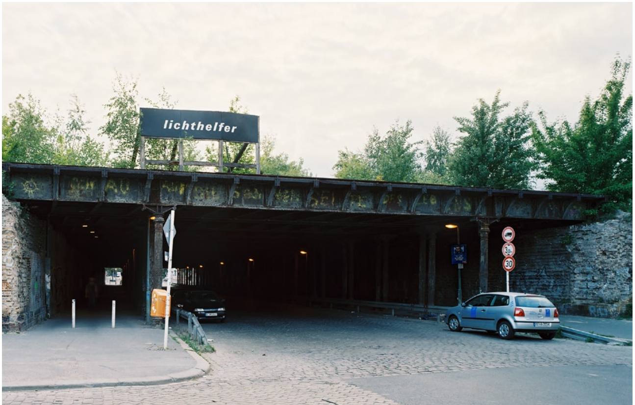
Das temporäre Kunstprojekt ist Ergebnis des Wettbewerbs "Kunst im Gleimtunnel" und entstand in Zusammenarbeit zwischen dem Quartiersmanagement Falkplatz und dem Kulturamt Pankow. Es wird gefördert durch das Programm Soziale Stadt und unterstützt durch DEGEWO, VELOMAX BERLIN, GRÜN BERLIN