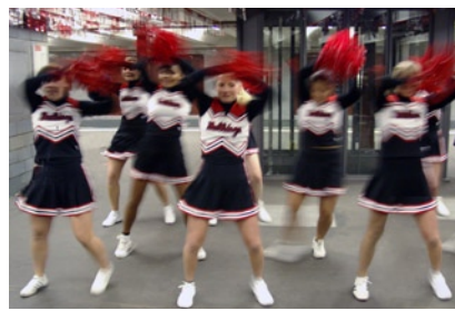
Die Cheerleader der Spandau Bulldogs eröffneten die Ausstellung.